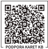
PODPORA KARET KB

Nově jsme nejen do letáků přidali praktickou vychytávku na jednoduché uložení nejdůležitějšího telefonního čísla ke kartám KB – QR kód s kontakty na Klientskou linku platebních karet. Stačí si QR kód načíst a uložit se Vám telefon i e-mail bez složitého přepisování. Můžete ho jednoduše přepsat i svým zaměstnancům – držitelům karet. V případě nepřijemností, jako je ztráta nebo krádež karty, je pak telefonní číslo „ihned po ruce“.