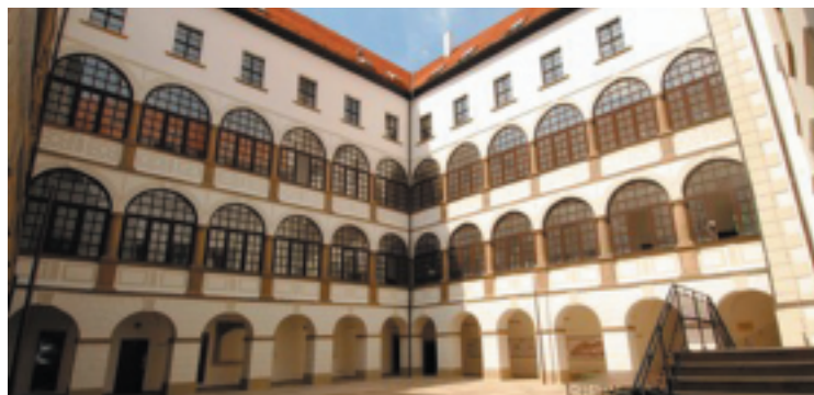
Nádvoří zámku v Uherském Ostrohu

Podnikatelské subjekty nebo projekty, které mají komerční charakter, mohou získat dotaci až 60 % z celkových způsobilých výdajů. Žadatelé typu obec, město, kraj a projekty, které nemají komerční charakter a nezakládají veřejnou podporu, mohou získat dotaci až 92,5 %. Mezi způsobilé výdaje patří nákup pozemků a staveb, stavební