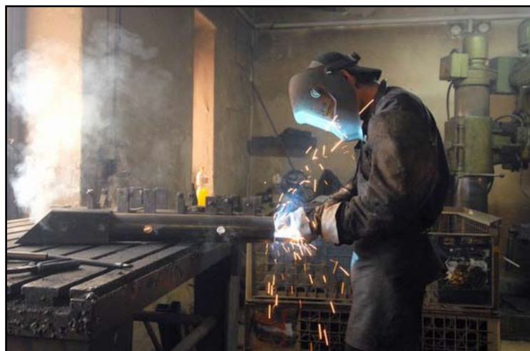
Výrobní prostory společnosti Buš a Buš, s.r.o.

V rámci Operačního programu Podnikání a inovace jsou dotace určeny například na úspory energií, zavádění inovací do výroby, modernizaci informační a komunikační technologie apod.