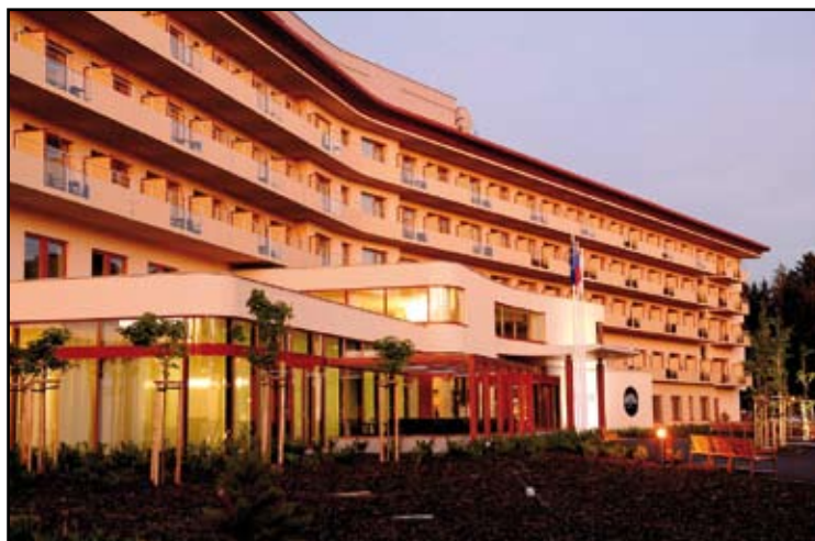
Lázeňský resort Strom Života, Lázně Bělohrad

Žadatelé mohou být podnikatelské subjekty (fyzické i právnické osoby), z PRV mohou žádat jedině podnikatelé, kteří se zaměřují na zemědělskou výrobu a lesnictví. Dále pak