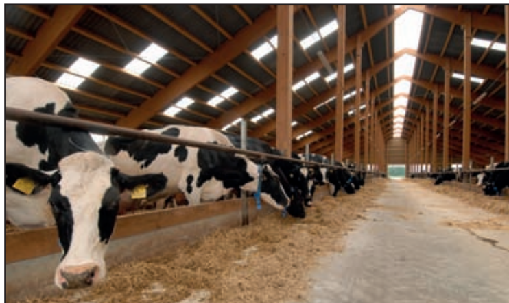
Nový kravín na farmě Kněžmost

Další oblastí, kam míří příspěvky z Evropské unie pro podnikatele v zemědělství, je vzdělávání. Podporuje se soustavné odborné vzdělávání pracovníků v tomto odvětví a využívání poradenských služeb zaměřených na větší efektivitu hospodaření. Dotace mohou čerpat i mladí zemědělci na zahájení činnosti.