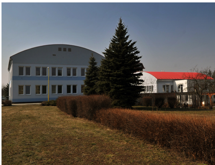
Zrekonstruované zdravotní středisko ve Starém Městě

Program Eko-energie podporuje výrobu energie z obnovitelných a druhotných zdrojů a také zvyšování účinnosti při výrobě, přenosu a spotřebě energie. To znamená, že je financována například modernizace, rekonstrukce a snižování ztrát v rozvodech elektřiny a tepla, zlepšování tepelně-technických vlastností budov, využití odpadní energie