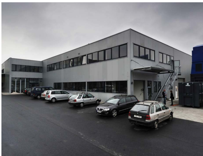
Nové školící středisko společnosti Colognia press

Z programu Školící střediska je financována výstavba, pořízení, rekonstrukce nebo modernizace prostor určených pro vzdělávání. Podnikatelé mohou získat dotace i na vybavení školicích center a vybavení školicími pomůckami, což zahrnuje například i vzdělávací programy a software. Podporované projekty tedy mohou být různé, od výstavby