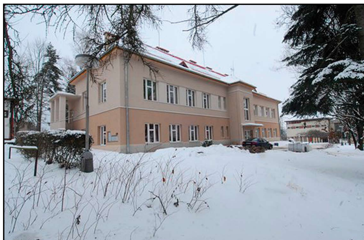
Zrekonstruovaná budova dětského pavilonu, Masarykova městská nemocnice Jilemnice

Z programu Eko-energie lze získat dotace v rozmezí 30–60 %, záleží na typu projektu a žadatele.