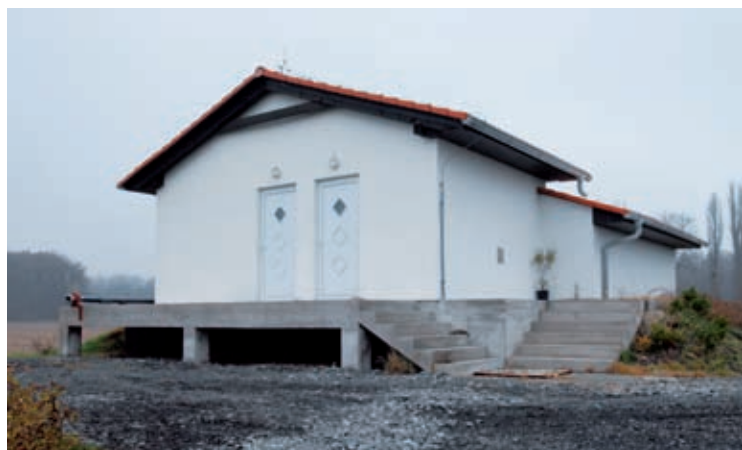
Čistička odpadních vod v Kovanicích

Na projekt lze získat dotace v maximální výši 90 procent způsobilých výdajů. Minimální způsobilé výdaje, ze kterých je stanovena dotace, jsou 50 000 Kč na projekt.