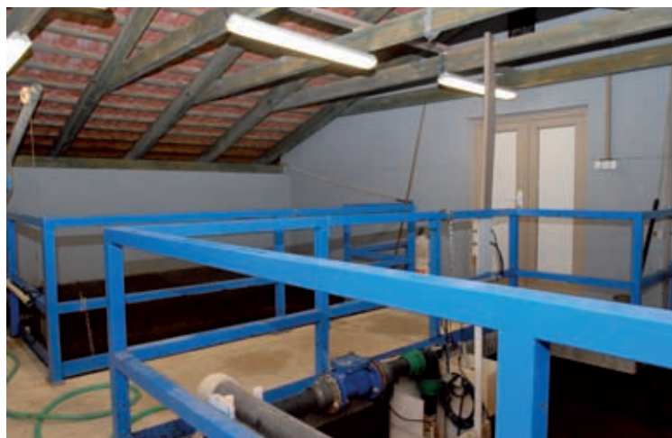
Z úvěrů ze zdrojů EIB či EBRD lze financovat i vodohospodářské projekty v malých obcích.

Úvěr mohou využít obce o velikosti do 100 tis. obyvatel. Dále příspěvkové organizace, které jsou těmito obcemi založené nebo vlastněné. Poskytování úvěru není nijak územně omezeno.