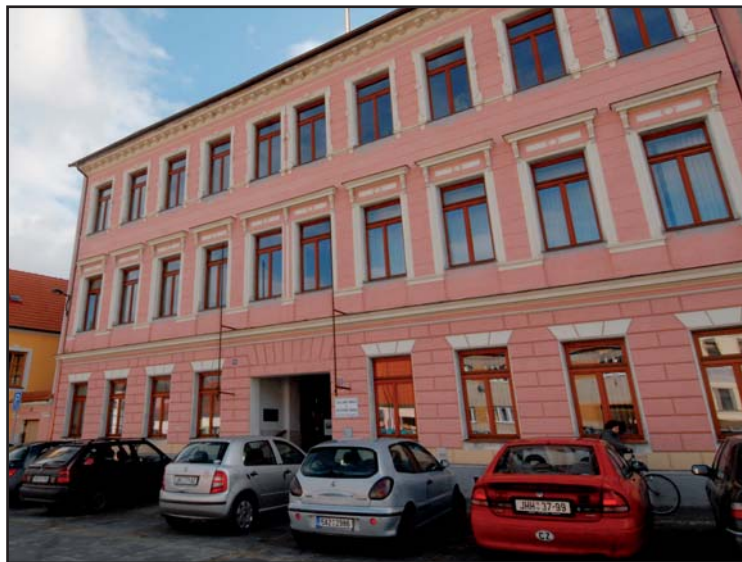
Zateplená budova Základní školy v Lomnici nad Lužnicí

V OP Životní prostředí je možné získat dotaci až do výše 90 % z celkových způsobilých výdajů (tedy nákladů, které jsou uznatelné). Od způsobilých výdajů se odečítají úspory energie za dobu 5 let, které jsou vyčísleny v energetickém