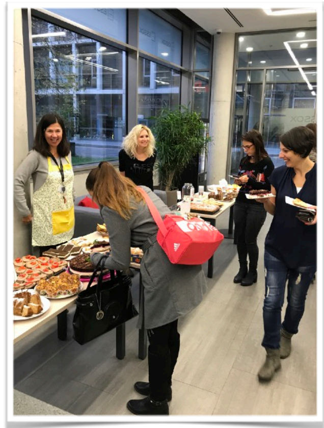
Snídaně pro Nadaci organizována zaměstnanci Skupiny KB

I v roce 2017 proběhl prodej nadačních kalendářů s motivy fotografií zaměstnanců Skupiny KB. Samotné fotografie si posléze mezi sebou zaměstnanci vydražili v tradiční vánoční aukci. Z této aktivity dostala nadace 43 165 Kč, které byly použity na podporu dlouhodobých projektů Nadace tak,