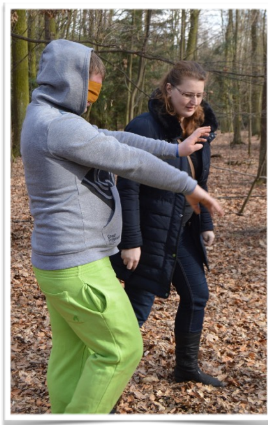
Salesiánský klub mládeže Centrum Don Bosco doprovází mladé lidi z dětských domovů na cestě k samostatnosti

Nadace jistota také dlouhodobě podporuje organizaci Sport bez predsudků, jejímž cílem je sportovními aktivitami předcházet vzniku sociálně patologických jevů. Na aktivity této organizace pomáhající dětem ze sociálně vyloučených lokalit Nadace v roce 2017 přispěla částkou 135 000 Kč.