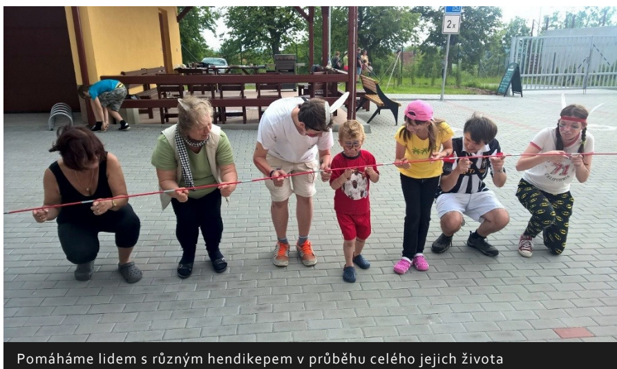
Pomáháme lidem s různým hendikepem v průběhu celého jejich života