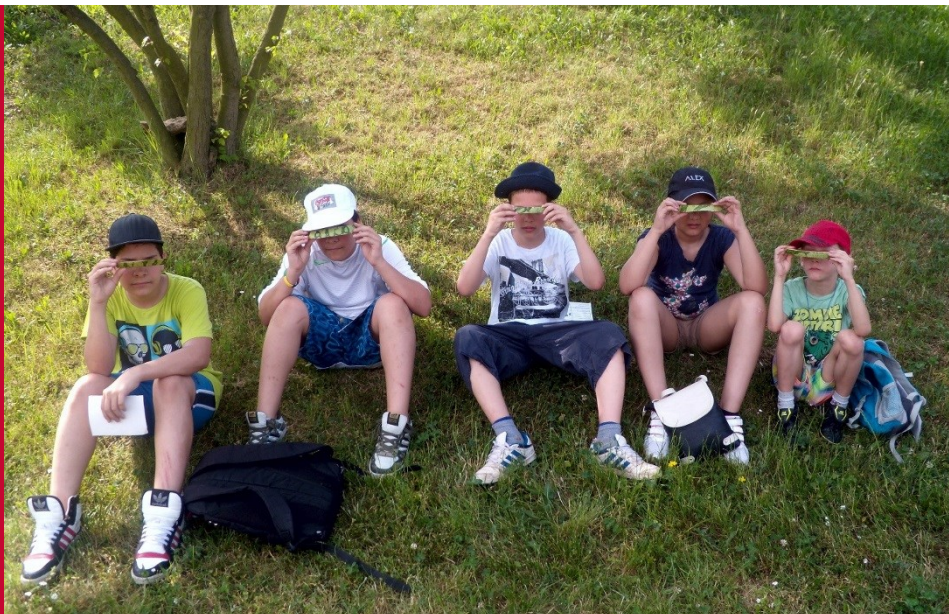
Pomáháme sociálně znevýhodněným dětem a dospívajícím

Prostředky byly použity na podporu dlouhodobých projektů Nadace tak, jak určili sami dražitelé, resp. kupující. Každý, kterému se podařilo dražbu obrazu vyhrát, se mohl rozhodnout, kterým směrem bude vydražená částka použita. Stejně tak tomu bylo v případě prodeje kalendářů. Výsledkem této benefiční akce byl výtěžek 98 768 Kč.