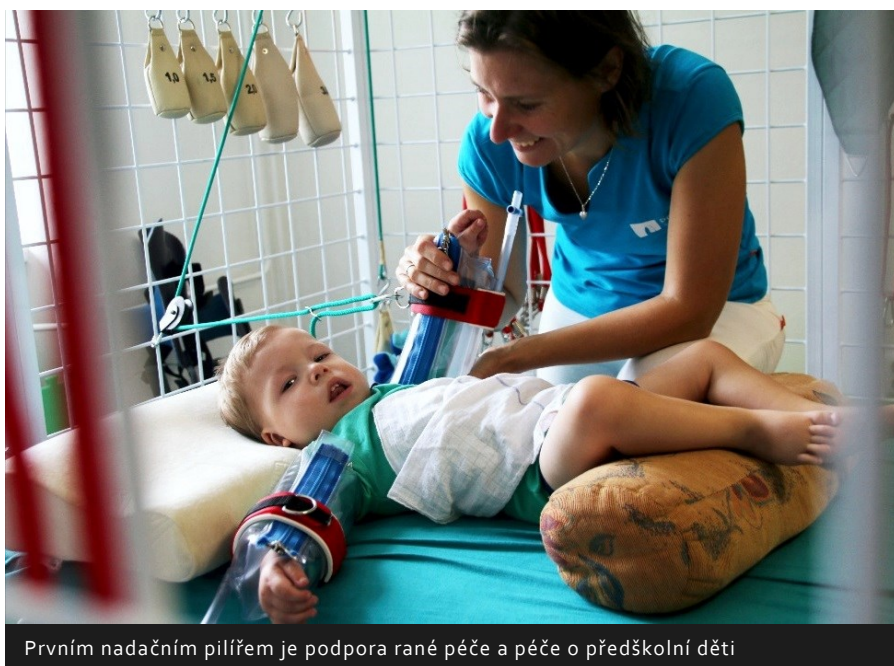
Prvním nadačním pilířem je podpora rané péče a péče o předškolní děti