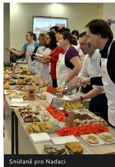
Snídaně pro Nadaci

Významnou podporu získává Nadace od zaměstnanců Skupiny KB. Ti se na činnostech Nadace podílí ať už formou pravidelného příspěvku, jednorázového daru nebo zapojením se do některé z benefičních akcí. V uplynulém roce tak zaměstnanci Nadaci přispívali například formou organizovaných benefičních snídaní, vánoční aukcí fotografií nebo účasti na golfovém turnaji. Nezřídka se zaměstnanci banky do činnosti Nadace zapojují také nefinanční podporou. Všem dárcům tímto děkujeme.