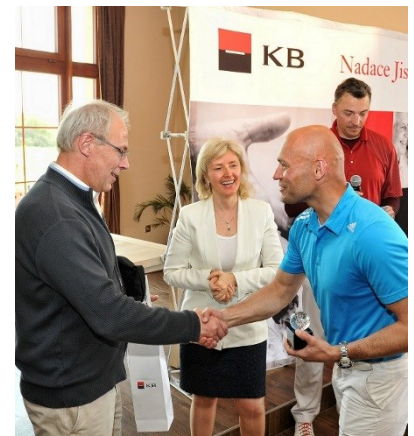
Golfový turnaj 2016

Celkem jsme tak v roce 2016 do pilíře podpory lidí se zdravotním hendikepem věnovali 1 720 846 Kč.