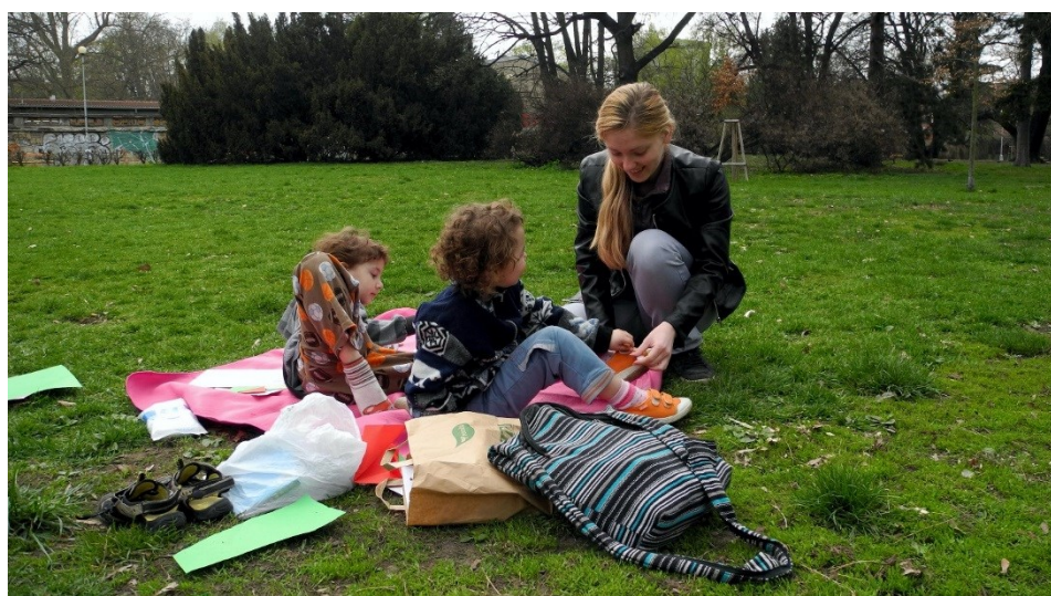
Nadace Jistota—partnerka pro celý život

Účelem nadace je aktivní podpora projektů a aktivit v oblasti rozvoje občanské společnosti, podpora vzdělávání a aktivní podpora projektů a aktivit zdravotně sociálního charakteru včetně podpory jedinců při začleňování do společnosti.