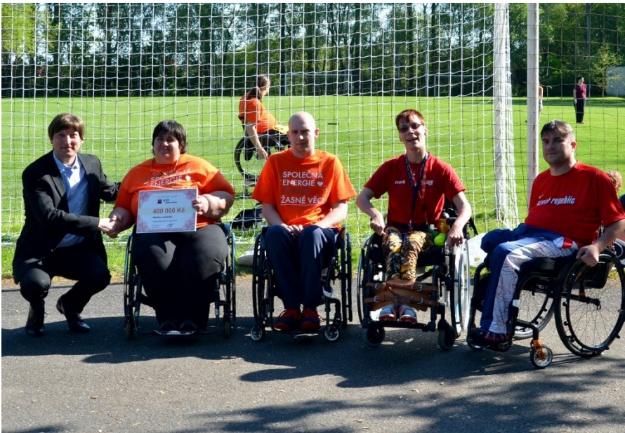
Podporujeme organizace sdružující hendikepované sportovce