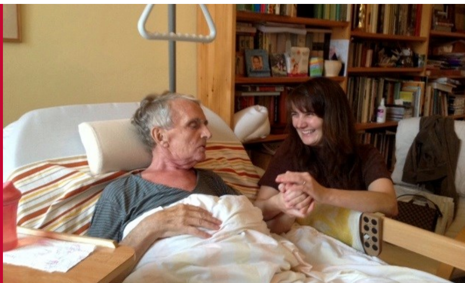
Důležitou oblastí je pro nás hospicová a paliativní péče